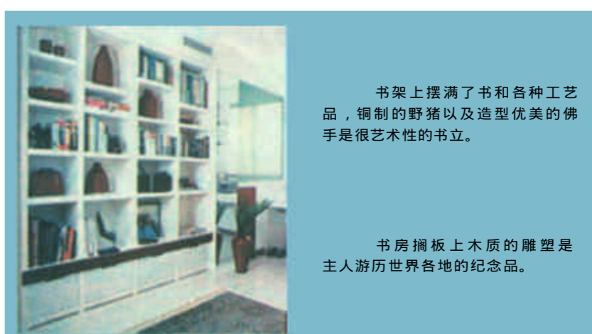
书架上摆满了书和各种工艺品，铜制的野猪以及造型优美的佛手是很艺术性的书立。