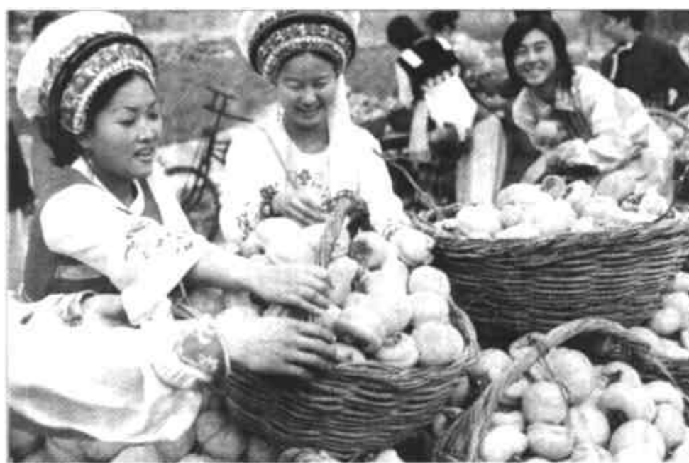
11月1日,两位白族姑娘在北京中华民族园赏柿子林参加该园一年一度的摘柿子比赛。当日,北京中华民族园的70余名少数民族员工代表参加了这一活动。

地通用专业技术特长的青年入伍。征集的女青年,应当是2003年的应届普通高中毕业生。依法应当缓征的正在全日制高等学校就学的学生,本人自愿应征并且符合条件的,可以批准入伍,原就读学校保留其学籍,退伍后准其复学。在征集年龄上,男青年为2003年年满18至20岁,高中毕业以上文化程度的青年和企业事业单位职工可放宽到21岁,大专以上文化程度的可放宽到22岁;女青年为2003年年满18至22岁。为适应部队的需要,根据本人自愿,可征集部分年满17岁的女青年和2003年应届高中(含职高、中专、技校)毕业的男青年入伍。