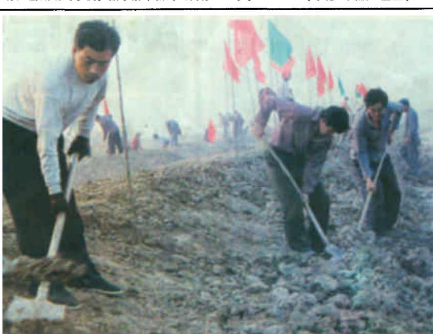
丁庄镇今年农业会战共上阵民工10000多名，动用机械17台、整理土方110万方，整修和疏挖沟渠路156条，配套建筑物166座。会后，可实现沟、渠、路、林、桥、涵、闸七配套，每年可为项目区增加收入600多万元。

法》增加了“自然人可以申请商标注册”的条款，加之工商部门加大宣传力度，进一步提高了自然人对商标知识的认可程度，向市场化运作迈出了重要的一步。(景伦 文波 金生)