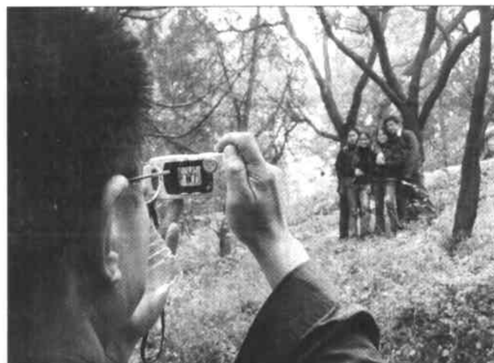
11月1日,几位游客在香山拍照留念。在深秋霜意浓烈,红叶染透北京西山的时候,连日来,香山公园内游人如织。山上弥漫的红叶芬菲,以及似团团圆圆火红的黄栌红叶,让游人流连忘返。

包括圣保罗男女中学、马鞍山信义中学和旺角劳工子弟学校等6所学校的学生,向杨利伟送上了自制的祝贺卡和火箭模型等纪念品,表达心中对英雄的爱戴。