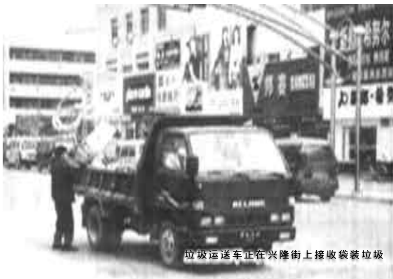
垃圾运输车正在兴隆街上接收袋装垃圾

本报讯 每天早上7点钟左右,垦利县兴隆街上就会缓缓驶来一辆福田翻斗车,车上播放着轻缓的音乐。听到音乐后,兴隆街上500来户经营业户,纷纷打开房门,将袋装的垃圾送到车上。这是垦利县市政局实行垃圾袋装化管理的一幕。