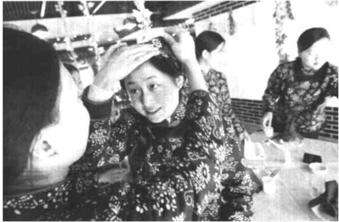
全国小城镇建设示范镇——广饶县大王镇以其优美的居住环境和发达的工商企业吸引着越来越多的外地人前来打工、经商。这位外地到该镇宾馆打工的姑娘上班第一天正在精心打扮自己。